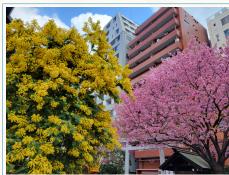
▲蔵前神社のミモザと桜