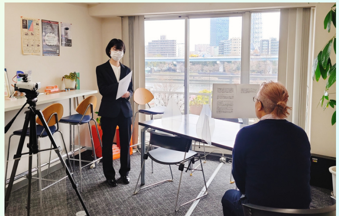
▲社内報：社長挨拶取材の様子

観光の取り組みに関する調査では、初めは目的の情報を探すことが出来ず苦戦しました。アドバイスを頂いたり、自分に合ったやり方を模索していったりする中で、コツを掴むことが出来て、目的の情報を見つけられるようになりました。今後も調査をしていく際に役立てていきたいと思っています。