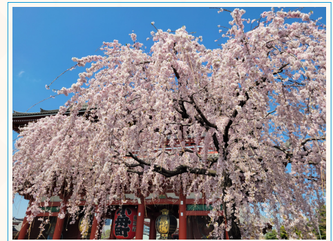
▲浅草寺の枝垂れ桜