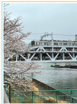
▲東武スカイツリーライン &隅田川&桜