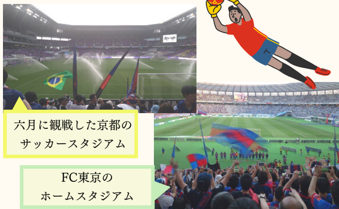
六月に観戦した京都のサッカースタジアム

その他に、野球とプロレスもずっと好きでときどき観に行きます。野球は学生の頃からよく観に行っています。